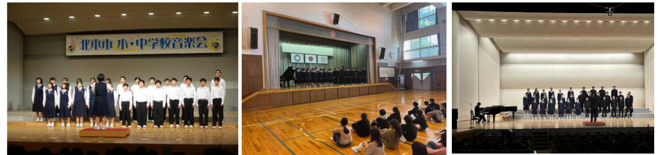
市内音楽会(1-1・北本市文化センター) 歌声交流会(3-1・中丸東小学校) 南部・北地区大会(3-1・上尾市文化センター) *****

さらに今年度は11月22日(水)に上尾市文化センターで埼玉県小・中学校音楽会南部・北地区大会が行われ、3年1組が北本市の代表として参加しました。