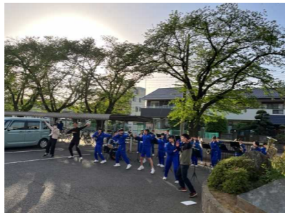
仮入部期間のデモ演奏(吹奏楽部)

本校は昨年度途中に剣道部を廃部として、現在は運動部11部、文化部4部で活動をしています。剣道部を含めた部活動の数は15年前に柔道部を廃止してから変化がありませんでした。部活動の数は変わらないということから、次のような課題が出てきました。1つには、各部活動の部員数が集まらず、1チームとして成立しない部活動が出てきたということ。もう1つは、生徒数の減少によって、学級数も減ってきているために